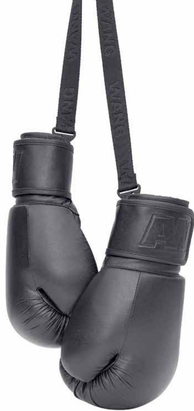
Gants de boxe Alexander Wang x H&M