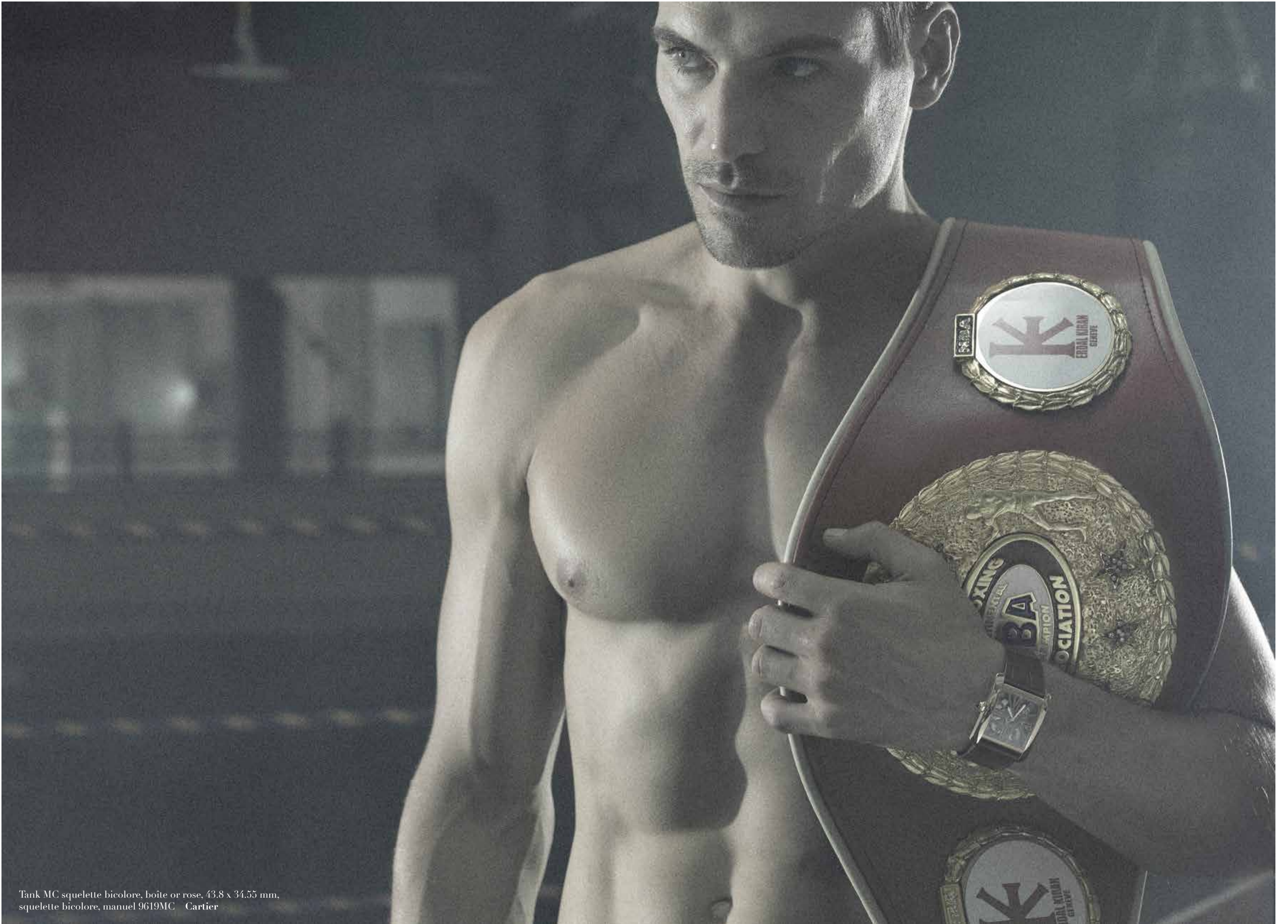
Tank MC squelette bicolore, boîte or rose, 43.8 x 34.55 mm, squelette bicolore, manuel 9619MC - Cartier