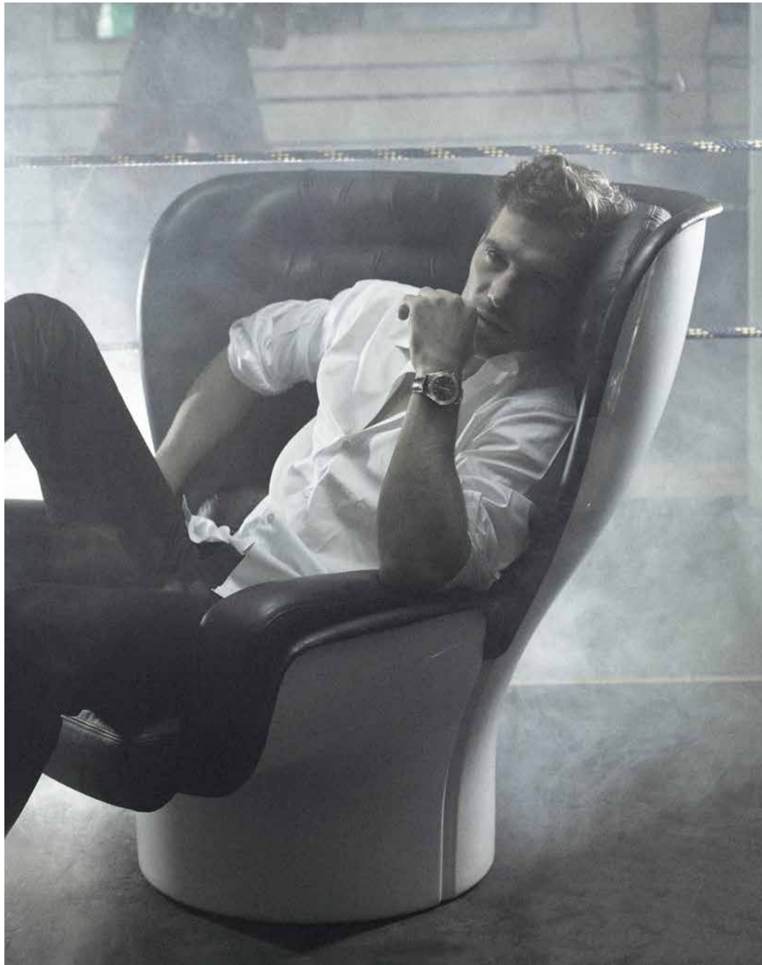
5961R chronographe calendrier perpétuel, calibre CH 28-520 IRM QA 24H, mouvement mécanique à remontage automatique, indication jour/nuit, boîtier serti diamants baguettes, cadran noir avec index diamants baguettes, boucle déployante sertie de diamants baguettes or rose - Patek Philippe

Chemise blanche Stefano Ricci - pantalon Dior Homme