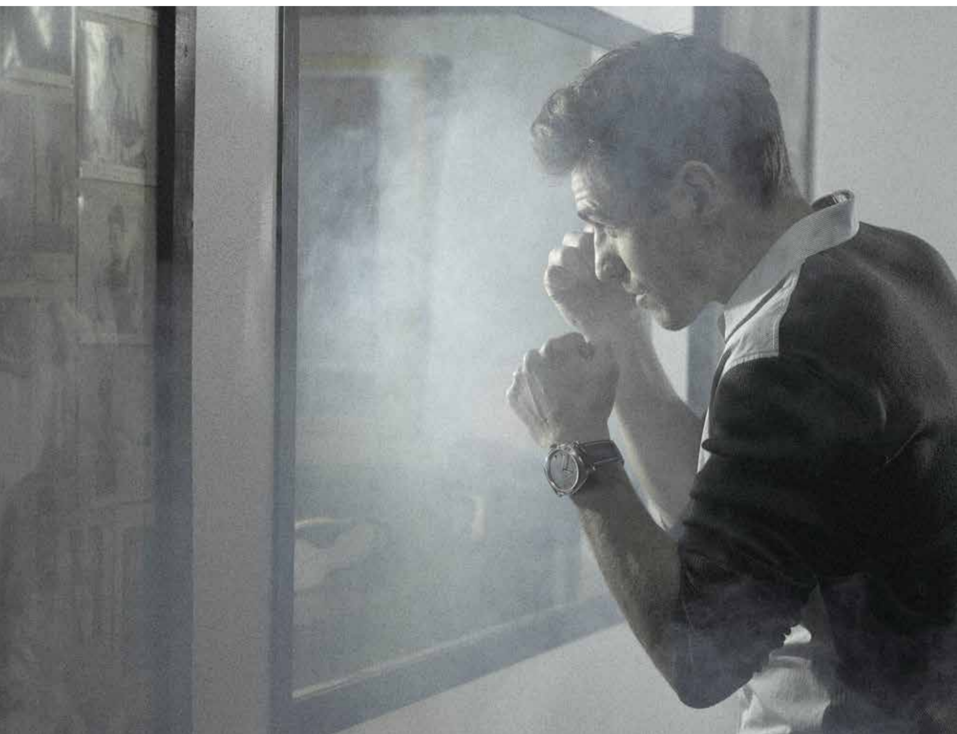
Boîtier 47 mm, or rouge, bracelet en alligator avec boucle en or rouge, cadran brun avec index des heures et chiffres arabes luminescents. Mouvement mécanique à remontage manuel - Officine Panerai