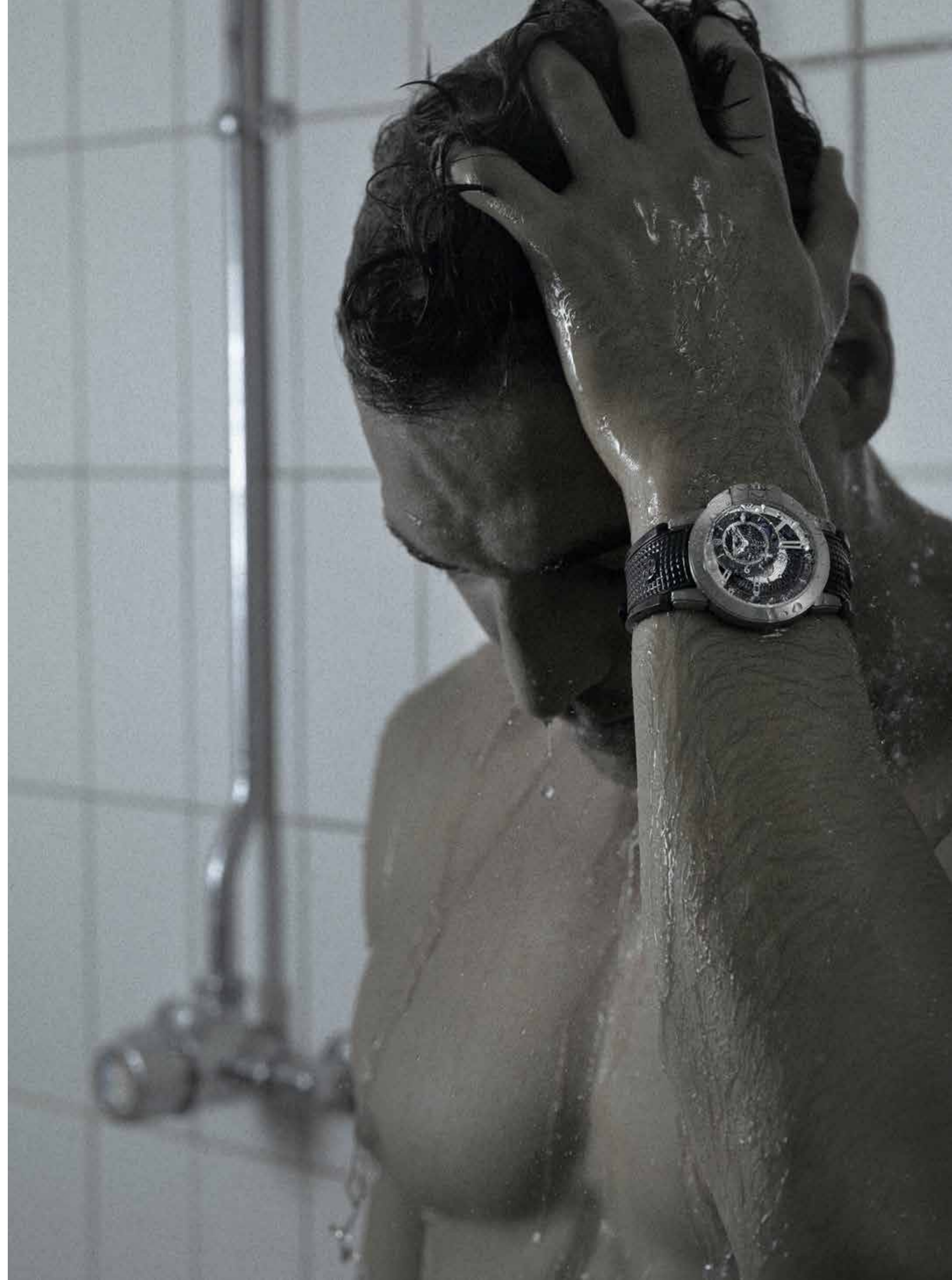
► Project Z8 en Zalium™, mouvement mécanique à remontage automatique, heures et minutes excentrées, indicateur jour/nuit, heure second fuseau horaire rétrograde. Edition limitée à 300 pièces - Harry Winston

Veste en cuir Salvatore Ferragamo Chemise et barre de col Dior Homme