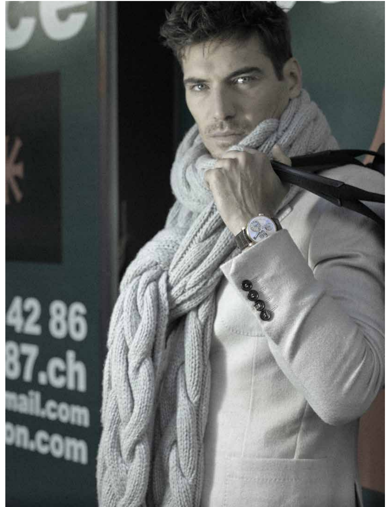
Legacy Machine 101, boîtier en or rose, diamètre 40mm, mouvement mécanique, balancier volant, indication de la réserve de marche, dôme en saphir bombé côté cadran - MB&F