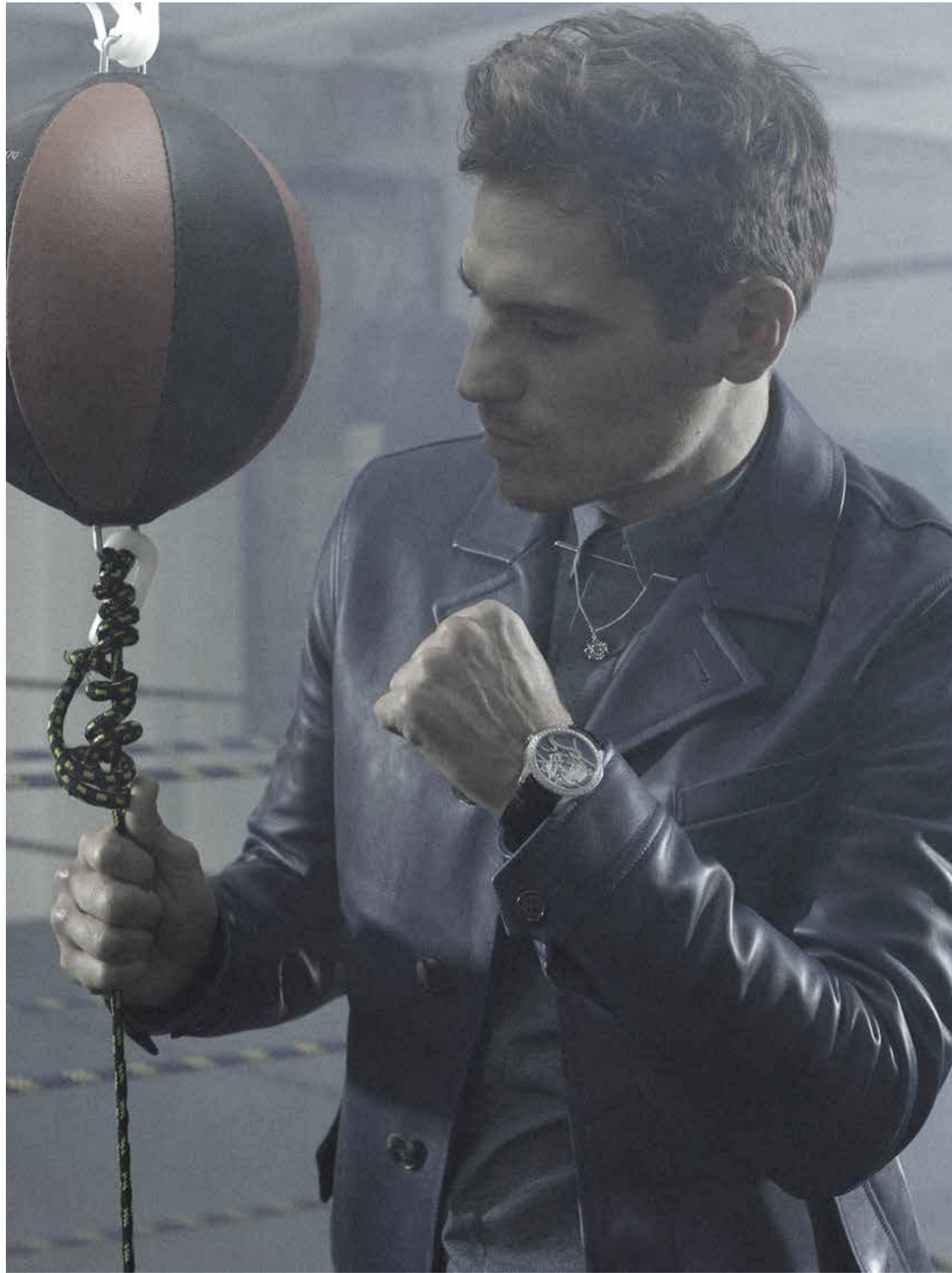
▲ Midnight Dragon Eau, automatique, boîte or blanc et diamants, email, nacre et laque, bracelet alligator - Van Cleef & Arpels

Veste en cuir Salvatore Ferragamo Chemise et barre de col Dior Homme